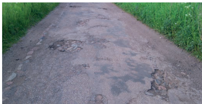
Aktualny stan nawierzchni

Niebawem rozpoczną się roboty budowlane na dwóch skrajnych odcinkach drogi gminnej nr 119027N (odcinki Weskajmy – Deksyty – Wiewórki oraz w Piasecznie). Dzięki pozyskanym środkom z Programu Rozwoju Obszarów Wiejskich na lata 2014-2020 przebudowanych zostanie łącznie 2,7 km drogi (roboty rozbiórkowe, wykonanie podbudowy, położenie nawierzchni bitumicznej, wykonanie przepustów, oczyszczenie rowów itp.). Łączna kwota dofinansowania to 1,595 mln zł, zakończenie prac planowane jest na listopad 2017 r.